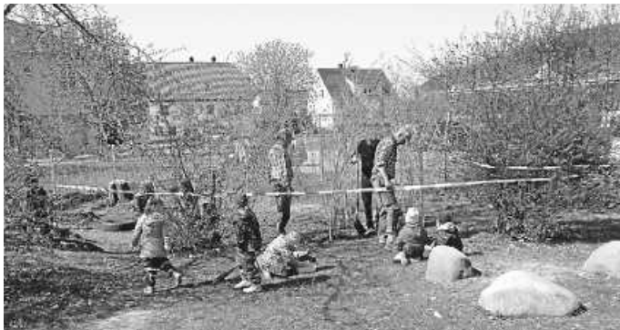
Der Weidetunnel wird gesetzt.

Vergangene Woche erfüllte sich für die Kindertagesstätte Im Donaupark ein lang ersehnter Wunsch. Entlang des Zauns, Richtung Straße, entsteht ein lebendiger und nachwachsender Weidetunnel.