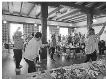
Vor dem Frühstück etwas Bewegung