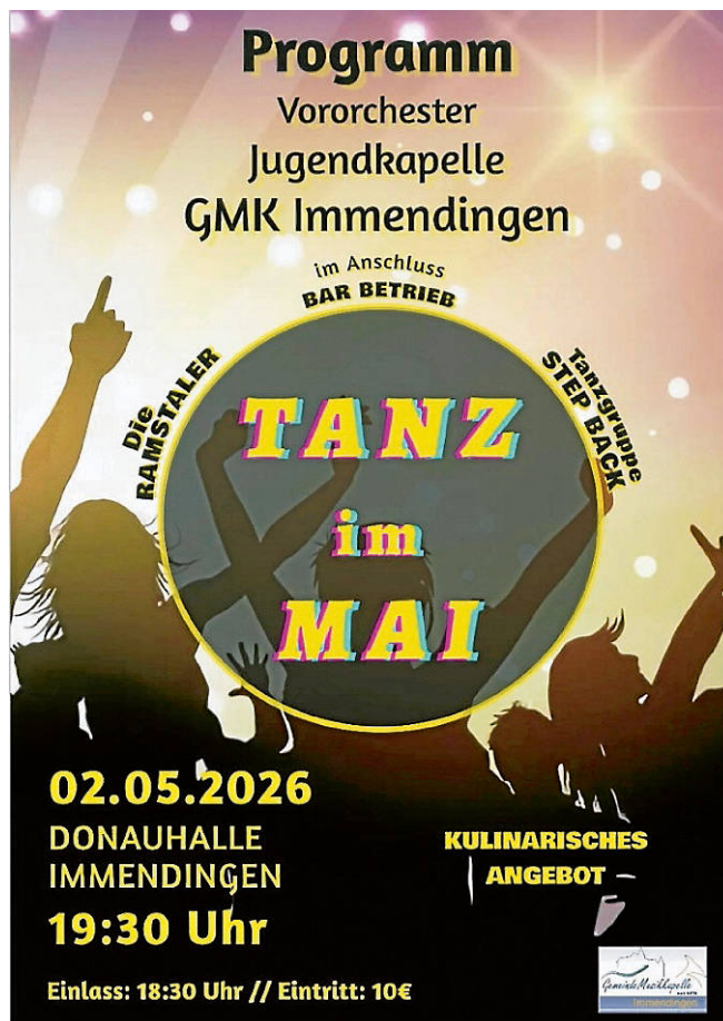
Plakat: GMK Immendingen

Wie bereits weiter oben und in den vorhergehenden Artikeln erwähnt, wirft der kommende Tanz seine Schatten bereits voraus. Seit einigen Wochen bereiten wir uns daher als Gemeindemusikkapelle Immendingen musikalisch als auch organisatorisch auf die bereits bewährte Veranstaltung vor. Neben Vororchester, Jugendkapelle und der Stammkapelle werden auch in diesem Jahr „Die Ramstaler“ wieder für gute Stimmung nach dem Konzert sorgen. Daher möchten wir an dieser Stelle auf unser Konzert hinweisen und würden uns freuen, viele interessierte Konzertbesucherinnen und Konzertbesucher hierbei begrüßen zu dürfen.