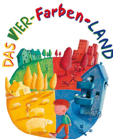
Plakat: Kiga St. Josef

Am 09.05.2026 öffnet der Kindergarten St. Josef in Immendingen seine Tore für das große Kindergartenfest im Vierfarbenland. Die Bevölkerung ist dazu recht herzlich eingeladen, dieses farbenfrohe Ereignis zu besuchen.