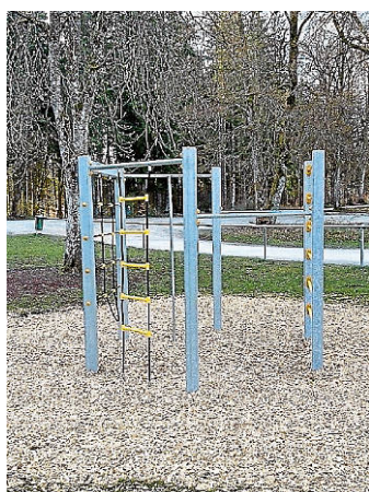
Der Spielplatz am Bumbis hat ein neues Klettersechseck bekommen.

In den letzten zwei Wochen haben sich unsere Bauhofs Mitarbeiter um die Spielplätze unsere Gemeinde gekümmert. Jetzt sind alle Spielplätze bereit für den Sommer. Vielen Dank an den Bauhof!