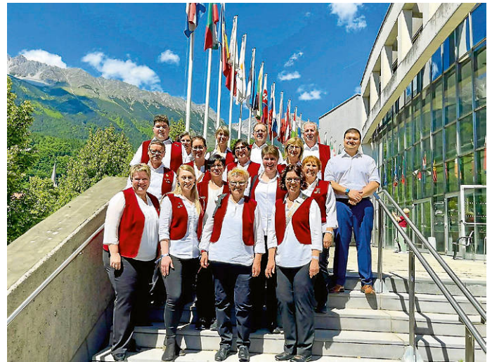
Stammorchester in Innsbruck 2025

Die beiden Bilder verdeutlichen eindrucksvoll den Wandel des Orchesters. Die gemeinsame Begeisterung für die Musik bleibt über die Jahre hinweg unverändert.