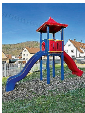
Der Spielplatz zwischen der Schreckensteinstraße und Danzigerstraße hat eine neue Treppe an den Rutschturm bekommen.