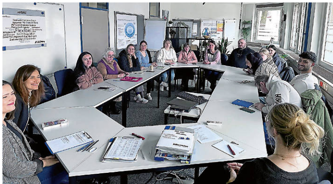
Teilnehmende beim praxisnahen Sprachtraining im Format MedDeutschLive.

Das Welcome Center ist eine Einrichtung der Wirtschaftsförderung Schwarzwald-Baar-Heuberg und der IHK Schwarzwald-Baar-Heuberg. Das Ministerium für Wirtschaft, Arbeit und Tourismus Baden-Württemberg sowie die Förderer des Welcome Centers unterstützen das Center.