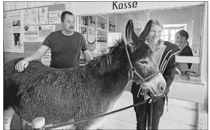
Die Eseldame Nora mit ihrer Tochter Amora

Die zweite Besucherin war die Eseldame Nora mit ihrer Tochter Amora, beide verzichteten jedoch auf ein Geschenk – sie wollten lieber schnell auf ihre Wiese vor dem Weberhaus, wo sie ab sofort bis November die Museumsgäste begrüßen werden.