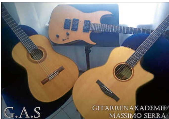
Konzert im Kulturhaus im Bürgerpark Tuttlingen

gramm aus den verschiedensten musikalischen Bereichen. Stücke aus den unterschiedlichsten Epochen, unterschiedlichsten Musikstilen wie Rock, Pop und Klassik, für Konzertgitarre und E-Gitarre stehen auf dem Programm. Die Schülerinnen und Schüler unterschiedlichsten Alters präsentieren sich Solo, im Duo und auch im Ensemble. Der Eintritt ist wie immer frei, über eine Spende am Ausgang freut sich das Heimat-Forum.