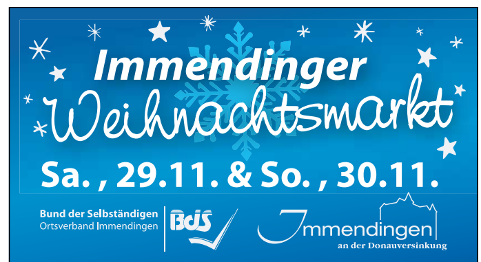
Plakat: BdS Immendingen e.V.

Ende November ist es wieder so weit: Die Gemeinde veranstaltet den 39. Immendinger Weihnachtsmarkt zusammen mit dem BdS vor der Kulisse des oberen Schlosses (und auch im Innenhof).