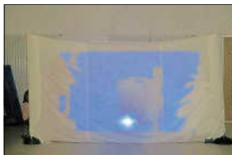
Goldtaler fallen vom Himmel