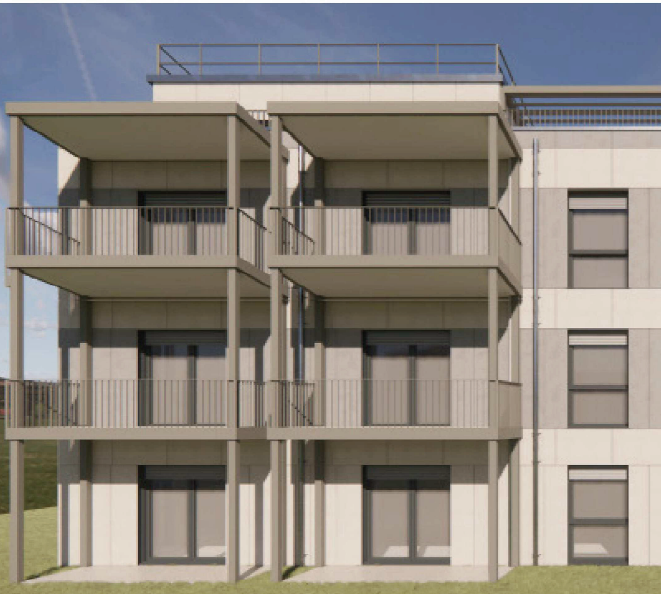
Cluster C | Süd Ansicht