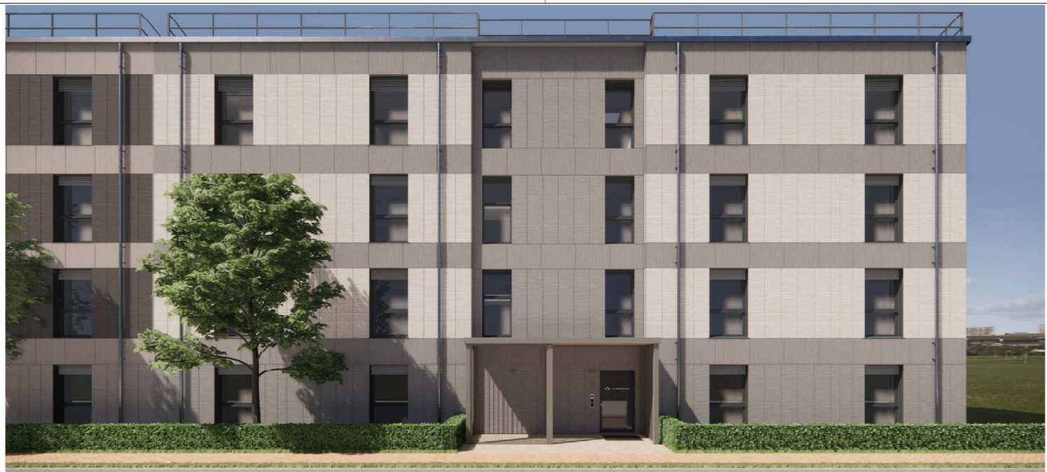
Cluster G | Nord Ansicht