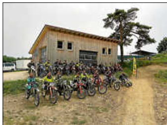
Der MCF Ippingen fleißig beim Training in Bräunlingen

Also kommen Sie vorbei und genießen Sie die Faszination am Rennsport, hautnah in Ippingen.