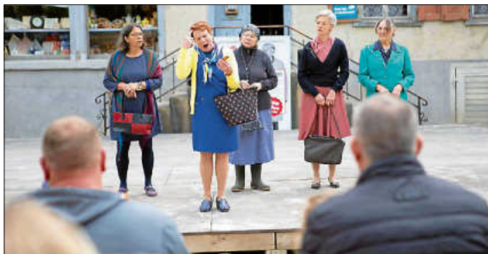
Am Wochenende des 27. und 28. September, zeigt das „Theater Freilich!“ das selbst entwickelte Stück „Geheimniskrämer“ über das Kaufhaus Pfeiffer direkt am Kaufhaus Pfeiffer.

Täglich um 11 und 15 Uhr werden im Museum die Hochgangsäge und die Hausmühle mittels Wasserkraft in Gang gesetzt. Um 14 Uhr startet die historische Schweinehut – eine Wanderung durch das Museum mit Lustigem und Interessantem zu den intelligenten Tieren.