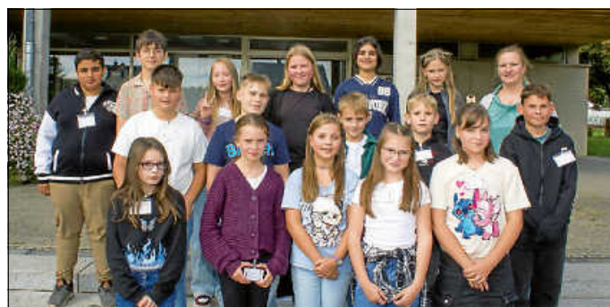
Klasse 5a WRS