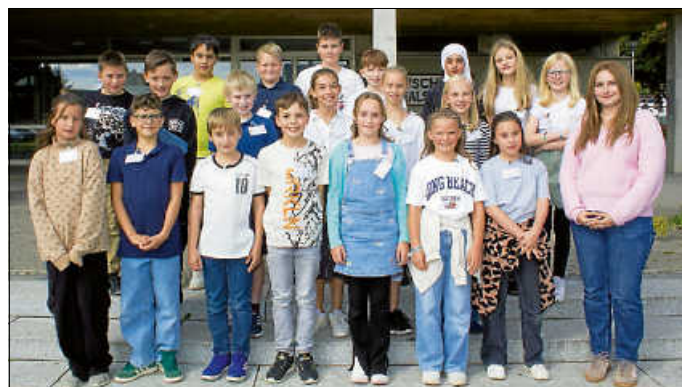
Klasse 5a RS