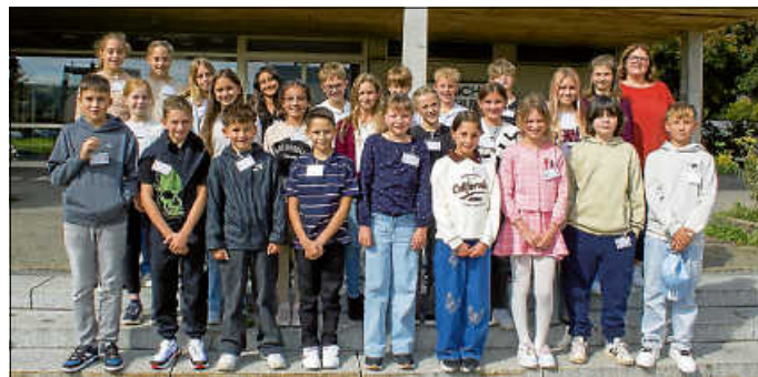
Klasse 5b RS