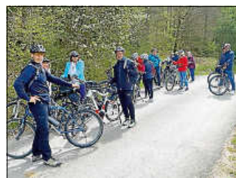
Die Radler 2024

Frei nach dem Motto „Ja, mir san mit'm Radl da“ geht's am Sonntag, dem 28.09.2025, ab 11:15 Uhr los. Treffpunkt am Parkplatz vor dem Oberen Schloss/Rathaus.