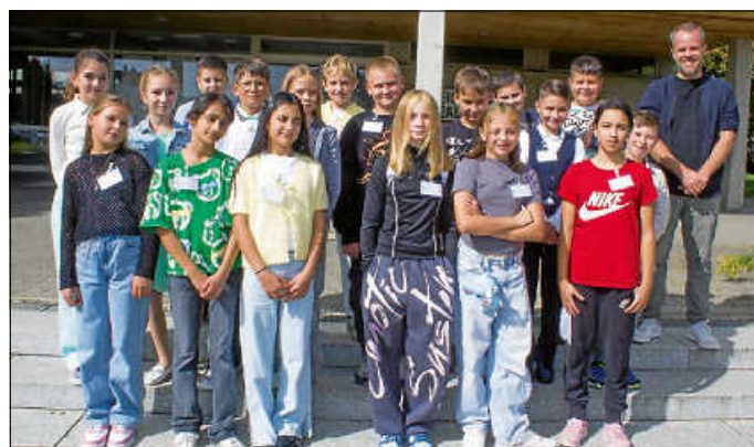
Klasse 5b WRS