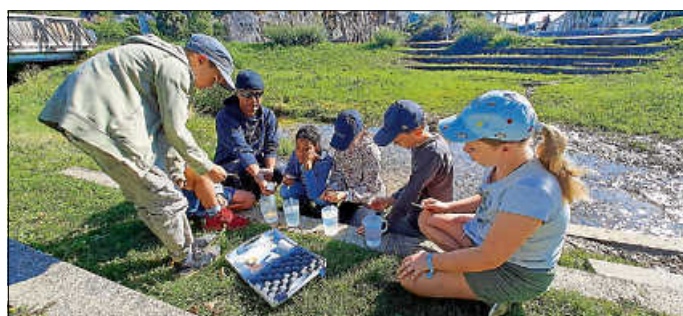
Gewässeruntersuchung - Wasserproben

Wir bedanken uns noch einmal herzlich bei allen teilnehmenden Organisationen, Personen und Vereinen für ihre tatkräftige Unterstützung und die Durchführung der zahlreichen Veranstaltungen sowie bei den Kindern und Jugendlichen, die daran teilgenommen haben.