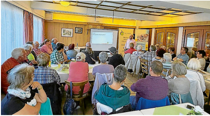
Teilnehmer Vortrag LRA TUT

90-minütigen Vortrags die Bereiche General- und Vorsorgevollmacht, Betreuungsverfügung, Patientenverfügung und Betreuungsrecht.