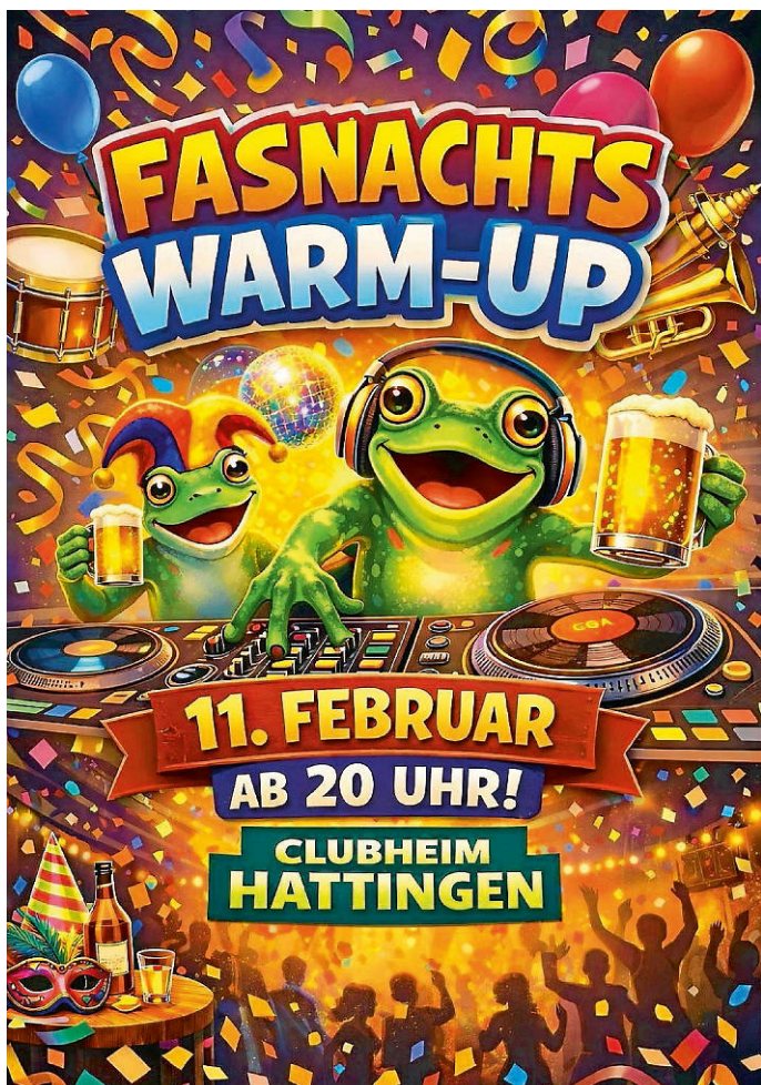
Plakat: Hattinger SV