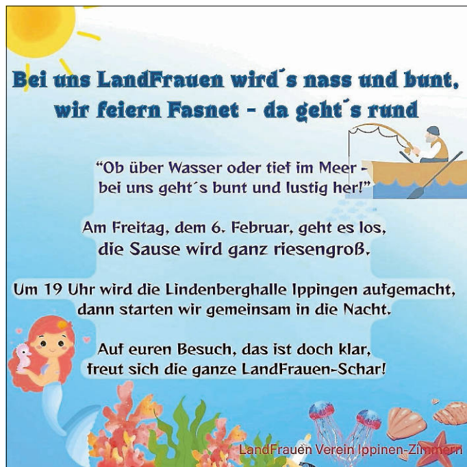
Plakat: LandFrauen Verein Ippingen-Zimmern

Wir freuen uns über Euren Besuch und auf einen feuchtfröhlichen Abend zusammen mit Euch. Es grüßen Euch ganz närrisch Die LandFrauen Ippingen-Zimmern