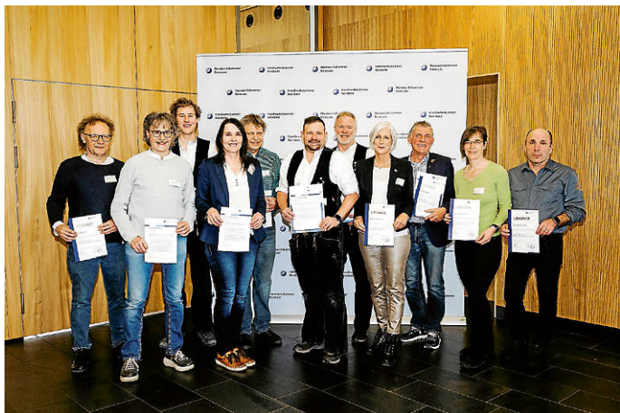
Gut aufgestellt für die Zukunft: die Absolventen des Pilotlehrgangs „Nachhaltigkeits- und Klimaschutzmanager im Handwerk“ bei der Zertifikatsfeier in der Bildungsakademie Singen.

Kurs findet vom 6. März bis 18. Juli 2026 in Teilzeit statt und umfasst zehn Seminar-Termine. Die Kosten von 1.950 Euro sind über die Fachkursförderung um bis zu 70 Prozent bezuschussbar. Anmeldung und weitere Informationen unter www.bildungsakademie.de/nahama .