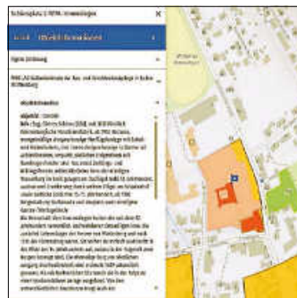
Beispielhafte Darstellung im Geoportal: Oberes Schloss, Schlossplatz 2, Immendingen

Der Denkmalschutz soll die originale Bausubstanz und das historische Erscheinungsbild von Kulturdenkmälern bewahren. Bauwerke sind Kulturdenkmale, wenn an deren Erhaltung ein öffentliches Interesse aus wissenschaftlichen, künstlerischen oder heimatgeschichtlichen Gründen besteht. Maßnahmen an einem Kulturdenkmal, welche in die Substanz eingreifen oder das Erscheinungsbild beeinträchtigen können, müssen