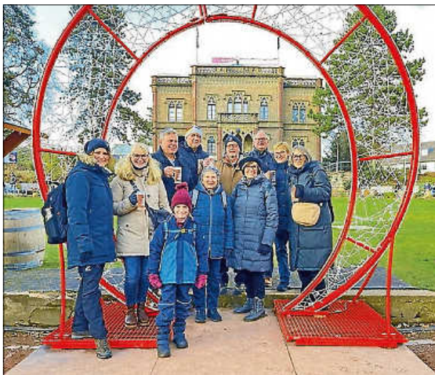
Auf dem Weihnachtsmarkt Freiburg

Erlebnis Freiburger Weihnachtsmarkt – Vorweihnacht ist Tradition und Zauber zugleich!