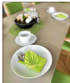
Begegnungscafé am Schloss

Jeden Dienstag von 14:00 - 17:00 Uhr wird in unserer Tagespflege am Schlossplatz 7 eine Beratung für pflegebedürftige Menschen und ihre Angehörigen gemäß §37,3 SGB XI durch geschulte Fachkräfte angeboten. Kommen Sie einfach während dieser Zeit vorbei oder vereinbaren Sie einen Beratungstermin mit unserer Pflegedienstleitung Manuela Drogin unter 07461 9669-72.