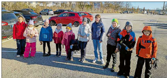
Unsere mutigen Jungteufel