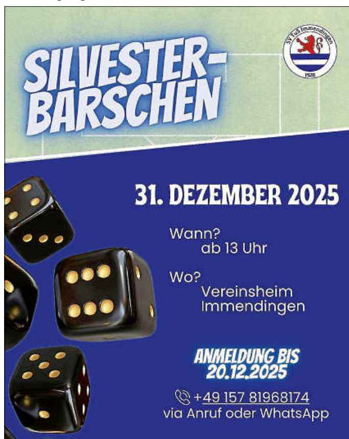
Plakat: SV Immendingen

Wir wünschen unseren Mannschaften viel Erfolg. Weitere Fußballinformationen unter: www.svimmendingen.de