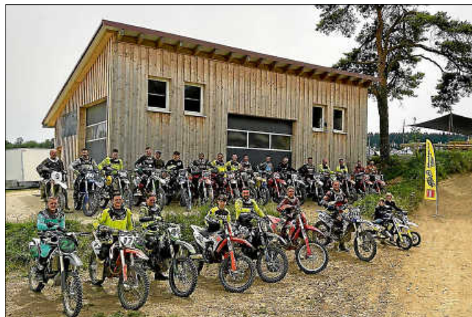
Der MCF Ippingen fleißig beim Training in Bräunlingen

Wir freuen uns auf Ihr Kommen und begrüßen Sie recht herzlich mit einer Rennwurst und einem Kaltgetränk am Himmelberg bei uns, dem MCF Ippingen e. V.