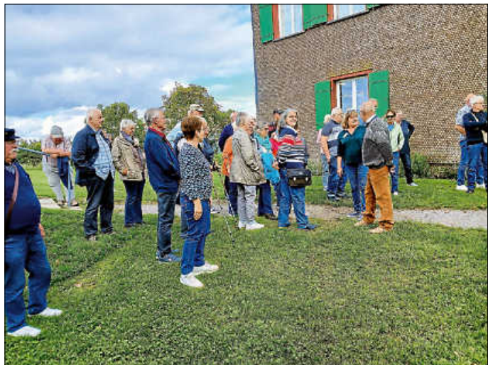
Rundfahrtstop am höchsten Punkt der Insel

Ausflugsrückblick: Trotz kühlem und regnerischem Wetter machten wir uns mit nahezu voll besetztem Bus auf den Weg nach Stein am Rhein. Nach einem 2-stündigen Aufenthalt (ohne Regen) ging's mit dem Schiff zur Insel Reichenau. Nach der Mittagspause erwartete uns bei herrlichem Sonnenschein die Gästeführerin zu einer interessanten und informationsreichen Inselrundfahrt. Mit einer Führung in der Kirche St. Georg und einer Kaffeepause endete der schöne Seniorenausflug.