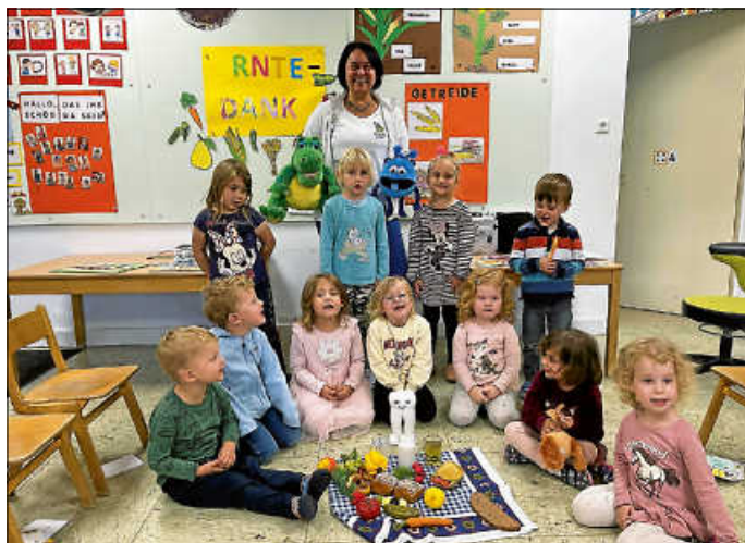
Kroko und Blue im Kindergarten Sonnenstrahl