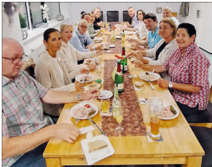
Abschlussfest der Hobbyspieler