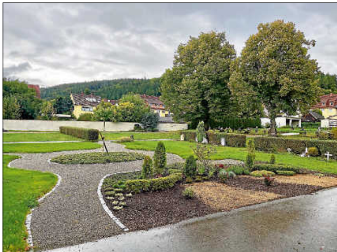
Jüngst wurde der „Erinnerungsgarten“ auf dem Friedhof in Immendingen durch ein neues Feld erweitert.

Fragen zum „Erinnerungsgarten“ können an die Friedhofsverwaltung gerichtet werden, Tel. 07462 24-225, E-Mail: info@immendingen.de . Auf der Homepage der Badischen Friedhofsgärtner eG finden Sie ebenfalls Informationen: http://www.erinnerungsgaerten-baden.de/privatkunden