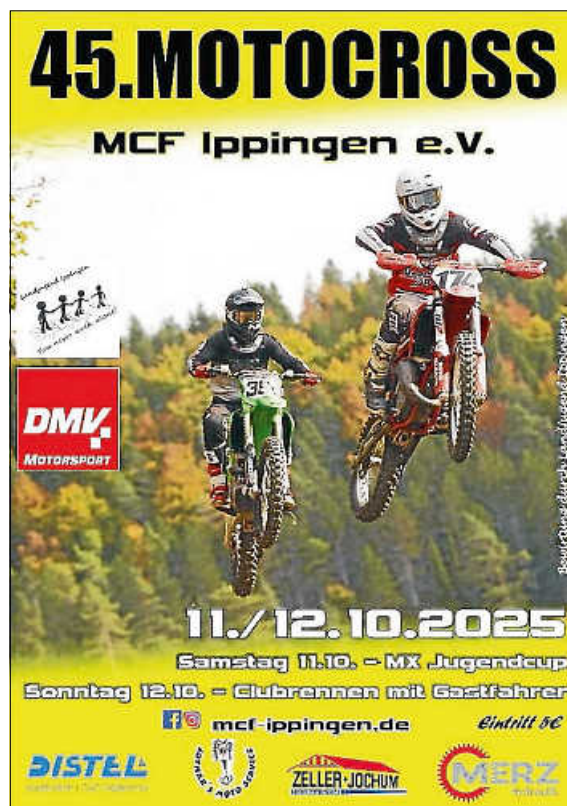
Plakat: Laju Ippingen

Auch dieses Jahr bewirten wir das Motocrossfest in Ippingen, welches am 11. und 12. Oktober 2025 stattfindet. Wir, sowie der MC Ippingen, freuen uns über viele Zuschauer an der Strecke und Besucher im Festzelt. Am Samstagabend findet ab 20:00 Uhr die legendäre Renndisco mit DJ, Barbetrieb u. v. m. im Zelt statt. Auch hier freuen wir uns über viele Gäste!