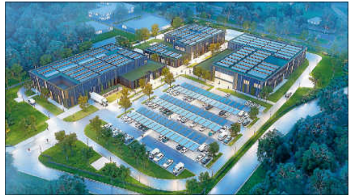
In Immendingen entsteht das elfte Einsatztrainingszentrum für den Zoll. Der Blick aus der Vogelperspektive zeigt die Entwurfsplanung für das Bauprogramm.

Goldbeck ist Partner für die mittelständische Wirtschaft und Großunternehmen, Investoren, Projektentwickler sowie öffentliche Auftraggeber. Zum Leistungsangebot gehören Logistik- und Industriehallen, Parkhäuser, Büro- und Schulgebäude, Sporthallen, Feuerwehrgebäude und Wohngebäude. Revitalisierungen sowie gebäudenaher Serviceleistungen vervollständigen das Spektrum. Das Unternehmen realisierte im Geschäftsjahr 2024/25 480 Neubauprojekte und 87 Revitalisierungen bei einer Gesamtleistung von 6,3 Mrd. Euro. Aktuell beschäftigt Goldbeck mehr als 13.000 Mitarbeitende an über 100 Standorten in ganz Europa.