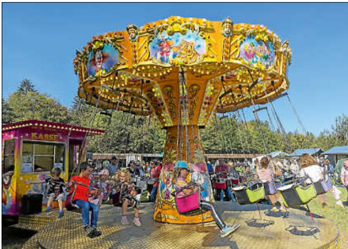
XXL-Kirbe: Vom 3. - 5. Oktober findet im Freilichtmuseum Neuhausen ob Eck die große Museums-Kirbe mit vielerlei Attraktionen statt.

An der Kirbe gilt wie immer der normale Museumseintritt, Kinder bis einschließlich 10 Jahre sind frei. Alle Infos zum Museum finden sich auf www.freilichtmuseum-neuhausen.de