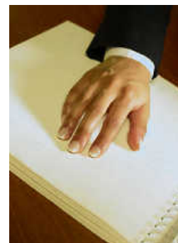
Blinden- und Sehbehindertenstiftung Südbaden